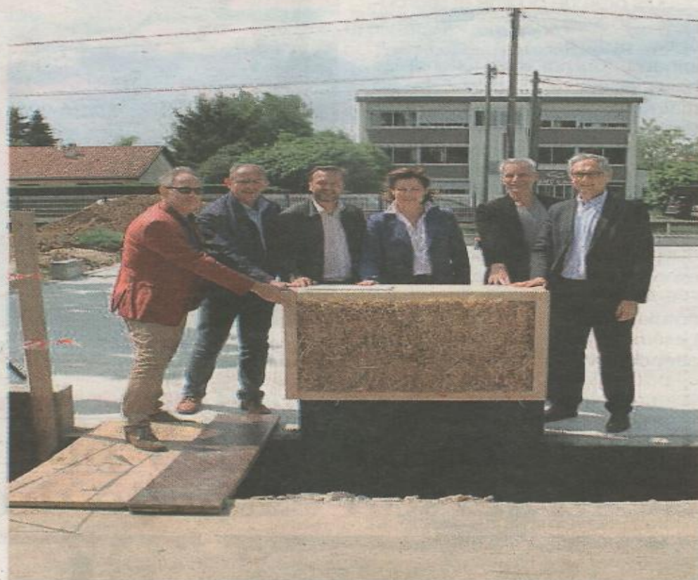
Les élus de la CCSB devant le premier parpaing de paille.

Ce projet d'envergure, dont le coût est de 1 million d'euros, est financé à hauteur de 80 % par un crédit Tepos (Territoires à énergie positive) et à 20 % par