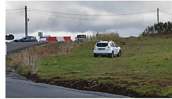
Tout est bon pour éviter la déviation