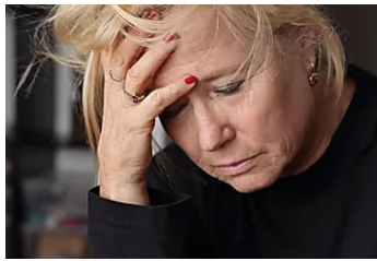
Arthrose après 50 ans ? Ne mangez plus jamais ces 3 aliments Santé Corps Esprit