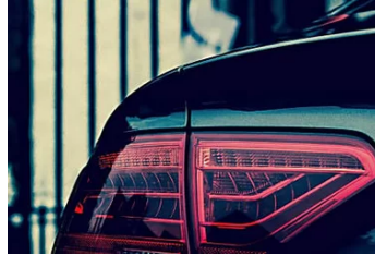
Les voitures les plus fiables : voici le palmarès