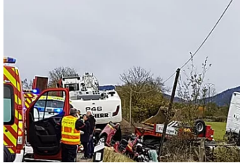
Collision entre un semi-remorque et un véhicule de pompiers: la RN102 a rouvert