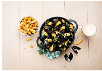
Avis aux gourmands: -20€ chez Léon Léon de Bruxelles