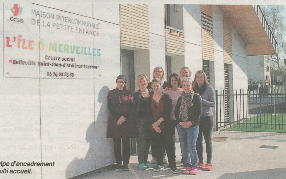
L'équipe d'encadrement du multi accueil.

vus d'un aménagement acoustique des surfaces, les sols sont recouverts d'un linoléum naturel, comme la farine de bois, le liège ou encore la toile de jute. Les peintures et vernis sont garantis sans composant organique volatil. Le système de renouvellement de l'air et l'étanchéité ont été également prévus selon les dernières technologies. Les besoins du bâtiment en chauffage sont minimes. Son orientation solaire lui permet d'optimiser ses apports de lumière. Deux champs de captage photovoltaïques avec une toiture équipée en conséquence, afin de produire de l'eau chaude.